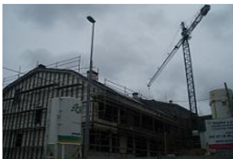
Edificación en el B° San Juan