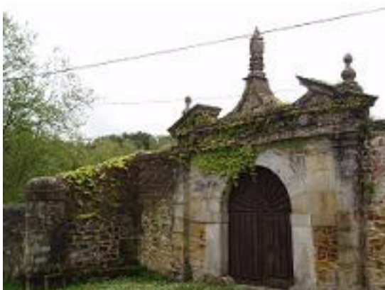
Parte delantera de la fachada del Palacio