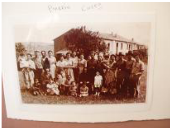
VECINOS DEL B° LOS COCES