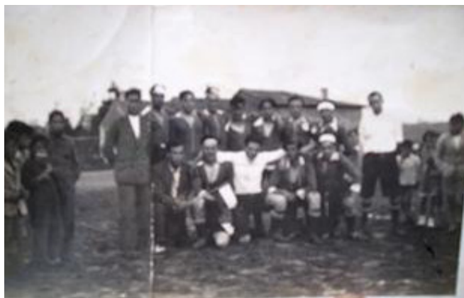
Equipo del “Sporting de Boo”

En cuanto a la diversión en el pueblo, se jugaba preferentemente a los bolos y al fútbol.