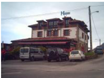
La Hostería de Boo en la actualidad.