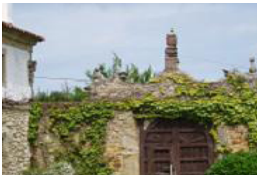
Parte trasera de la fachada del Palacio

Todavía, al día de hoy, y en la parte oeste de lo que una vez fue El Palacio, hay unas piedras que pertenecían a los muros exteriores del edificio.