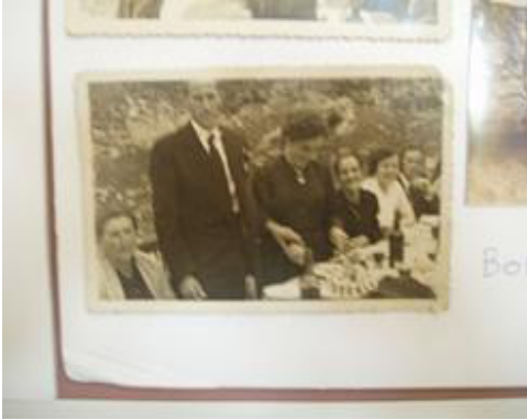
BODA DE ROSA