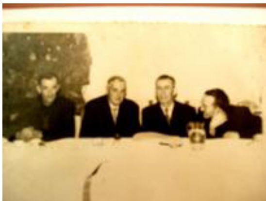
LOS ALCALDES YA CITADOS EN EL LIBRO