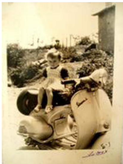
LOLY DE PEQUEÑA EN LA VESPA