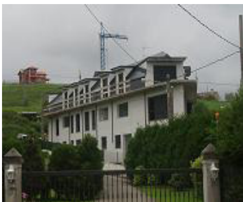
Edificación en el B° La Pedraja