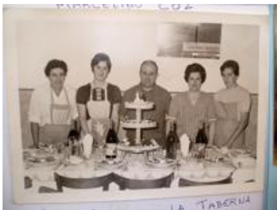
LOLY CON OTROS VECINOS