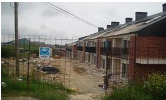
Edificaciones en el B° San José

Actualmente, el pueblo de Boo, está en constante expansión debido a su situación, a mitad de camino entre los dos grandes ciudades, Santander (capital) y Torrelavega. Y también a la proximidad, sin grandes agobios, de las playas.