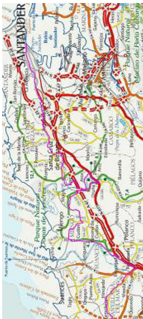
Camino de Santiago