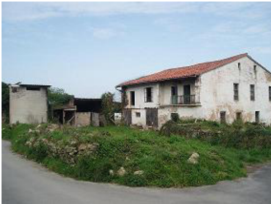
Casa que se construyó dentro del recinto del Palacio