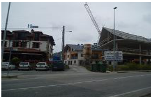
Edificación junto a La Hostería de Boo