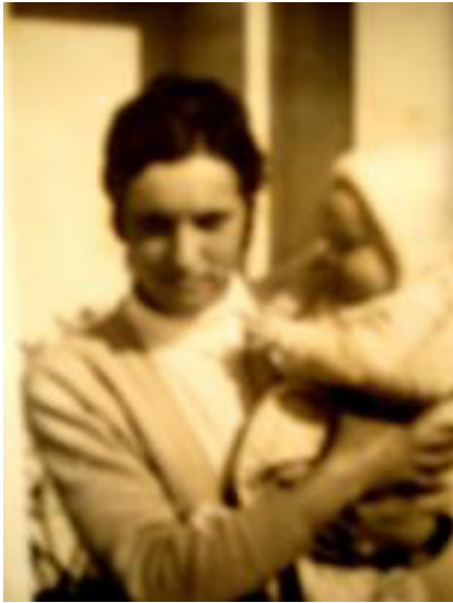
PILI CON SU NIÑO